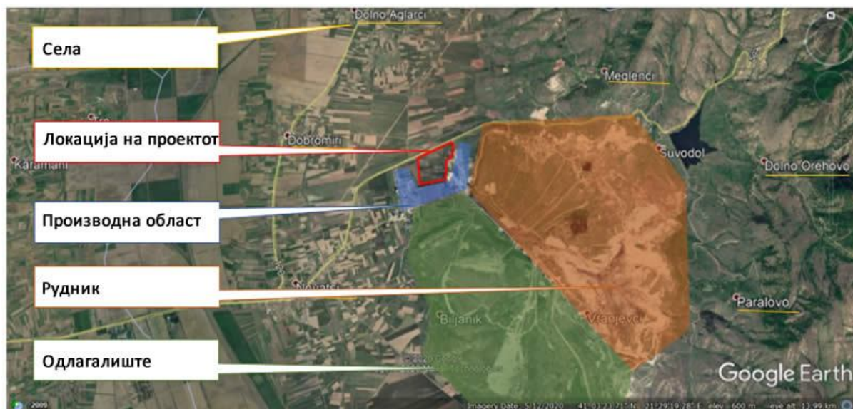
Слика 1: Макро локација на проектот и неговата околина

На северната страна локацијата се граничи со локален асфалтиран пат ( P1311 ). Покрај патот се наоѓа воден канал и подземен цевковод што носи вода од резервоарот за вода во Стрежево до РЕК Битола. Индустрискиот комплекс РЕК Битола е составен од рударска површина (јаглен лигнит), подрачје за производство на електрична енергија, депонија за одлагање на пепел, како и други помошни области (патишта, акумулација на вода итн.).